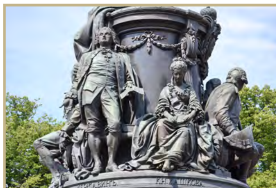
Памятник Екатерине Великой с фигурой Г.Р. Державина. Санкт-Петербург, 1873