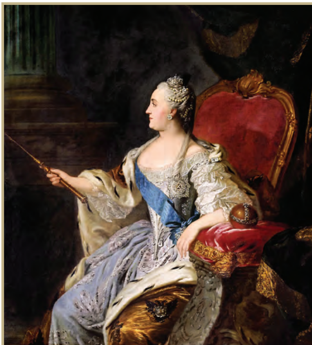
Портрет Екатерины Великой. Ф.С. Рокотов, 1763

йсками для подавления мятежа генералу Бибикову и выбил себе назначение в секретную следственную комиссию. Державин отлично проявил себя в борьбе с пугачёвцами: «Тогда помянутый поручик с сотнею крестьян и полусотней гусаров выступил в степь против киргизов и, встретив на четвёртый день их партию числом свыше полутора тысяч, разбил их и обратил в бегство». В своих мемуарах Державин точно описал всю ситуацию борьбы с Пугачёвым — он был в центре событий: составлял список мятежников, контактировал с правительственными силами, опрашивал население, географически точно описывал знакомые ему с детства места. Поэтому А. С. Пушкин, работая над «Историей пугачёвского бунта» и «Капитанской дочкой», в значительной степени опирался на материалы Державина.