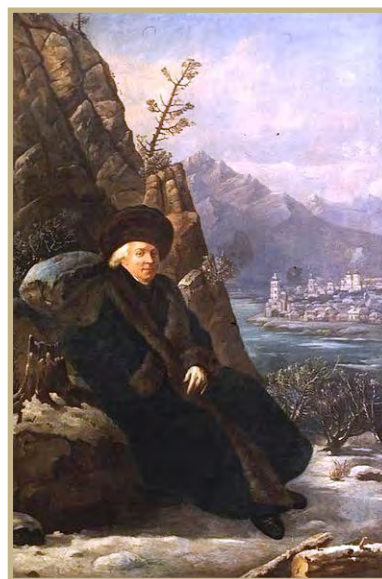
Портрет Г.Р. Державина. Н. Тончи, 1801 г.

Поэт Б. Садовской отмечал: «Заурядным чиновником Державин не был. Жизнь его полна приключений. Бедный казанский гимназист, ученик ссыльного каторжника, после Измайловский рядовой, затем отважный офицер, преследующий с Бибиковым Пугачёва, волею судеб превращается в важного государственного мужа. Под конец мы видим его величавым любезным старцем, министром на покое, мирно гуляющим по саду в своей Званке, в халате и колпаке, с грифельной доской в руках, с собачонкой за пазухой».