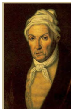
Портрет Г.Р. Державина. А.А.Васильевский, 1815 г.

воспитывались три осиротевшие племянницы его супруги.