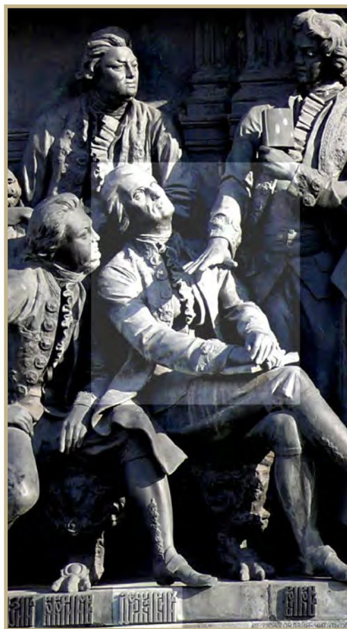
Поэт на памятнике «1000-летие России» в Великом Новгороде

Державин — сложная натура. Вся его творческая жизнь захвачена громадой бытия, что осознано им, великим поэтом, юридическим деятелем, первым министром юстиции, и воспроизведено в стихотворной форме его ощущением себя как частицы Бессмертного, Безначального и Бесконечного: