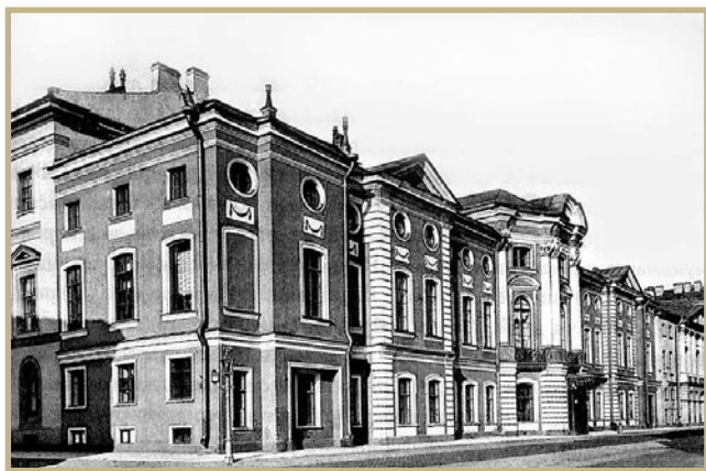
1. Здание Министерства юстиции до 1917 г.