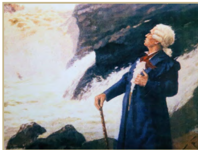
Державин на водопаде Кивач в 1785 году

Вместе с признательностью «руководства» к Державину пришла широкая литературная извест-