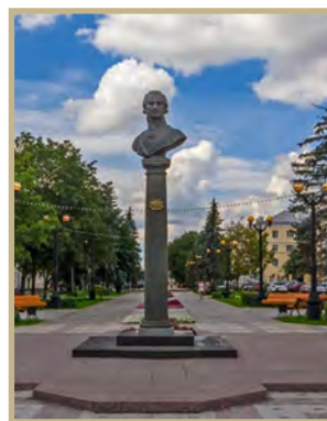
Памятник Державину на Державинской (б. Наместнической) улице в Тамбове

рина II утвердила оправдательный приговор Сената, однако новую должность предоставлять Гавриилу Романовичу не торопилась, сказав: «В третьем месте не мог ужиться; надобно искать причину в себе самом... Пусть пишет стихи».