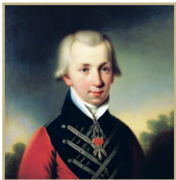
Портрет молодого Державина, сформированный нейросетью

обходительным; также представлять на театре трагедии Сумарокова, танцевать и фехтовать, что сделало питомцев хотя в науках не искусными, однако же доставило „людность“ и некоторую развязность в обращении». «Нас научали тогда вере — без катехизиса; языкам — без грамматики; числам и измерению — без доказательств; музыке — без нот, и тому подобное. Книг, кроме духовных, почти никаких не читал». Позже самообразованием Державин во многом нивелировал все пробелы в знаниях.