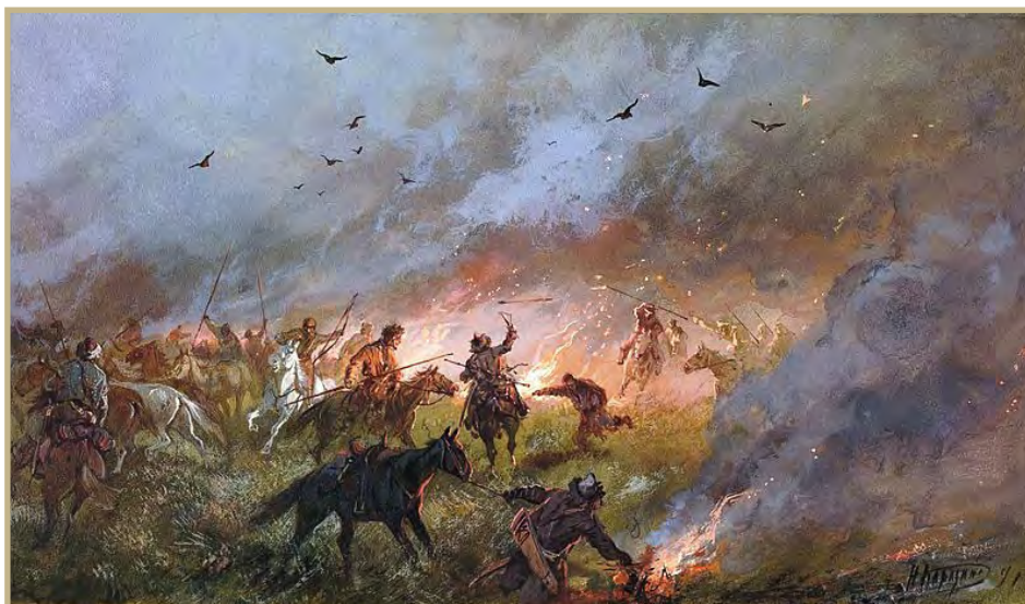
Поражение скопищ самозванца под Троицком 21 мая 1774 г. Н.Н. Каразин, 1891

ность. Он стал одним из первых литераторов своего времени. В открывшейся Императорской Российской академии наук Державин вместе с Фонвизиным и другими составляли первый толковый словарь русского языка.