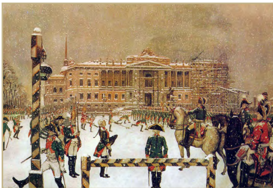
Участие императора Павла I в разводах и вахт-парадах гвардии. Парад при Павле I. Александр Бенуа, 1907

Державина». Стоит при этом учитывать, что в понятие «конституция» дворянство XVIII — начала XIX века вкладывало другой смысл, чем это принято сейчас. Современники понимали конституцию как, во-первых, ограниченную представительным органом власти форму монархического правления, во-вторых, как основные законы, обязательные для исполнения главой государства.