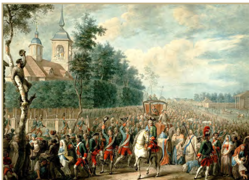
◀ Иоахим Кестнер. Шествие Екатерины II по Петергофской дороге в день дворцового переворота 28 июня 1862 года. Преображенцы.

Лишь в 1772 году Державин был произведён в прапорщики, а в 1777 году отправлен в отставку. Ещё через год случился пугачёвский бунт. Державин не сомневался, что Пугачёв — бунтовщик и самозванец, и мечтал отправиться на усмирение бунта, но гвардию для этого не использовали. Тогда он без рекомендаций явился к главнокомандующему во-