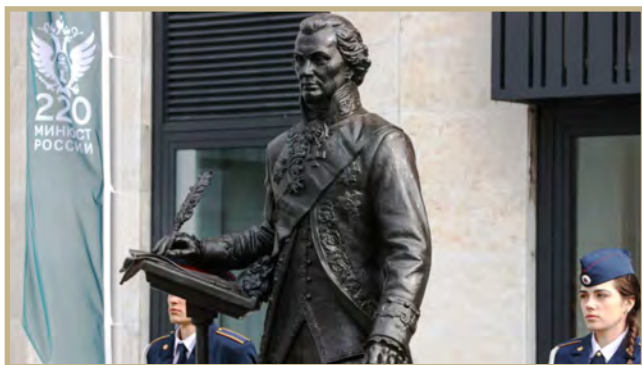
Памятник Державину, открытый в честь 220-летия Минюста России

Ему установлены памятник и бюст, медаль его имени — главная ведомственная награда министерства. Заслуги, за которые работники Минюста получают эту награду, — это основные позиции, которые отстаивал Гавриил Романович в своей славной государственной службе на благо Отечества.