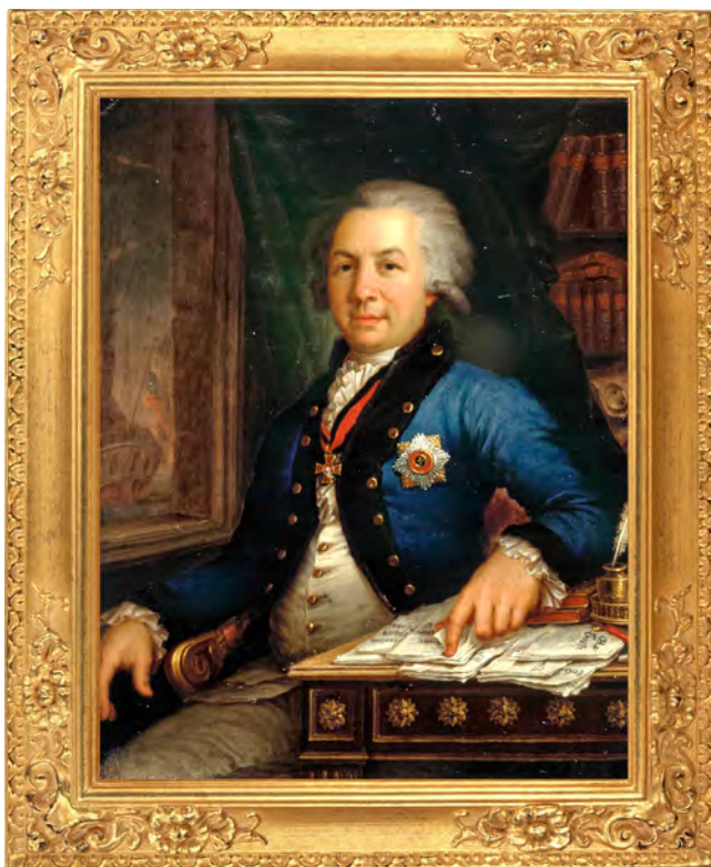
Портрет Г.Р. Державина. В.Л. Боровиковский, 1795

При весьма низком уровне обучения в молодости самообразование помогло Державину стать исключительным знатоком литературы, истории Отечества, правоведом и ценителем искусств.