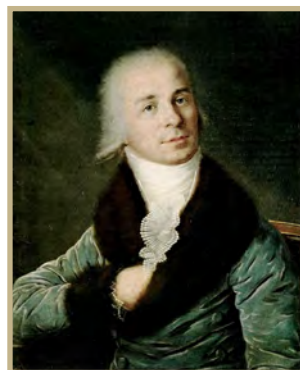
Портрет Г.Р. Державина. И.Смирновский, 1790-е годы

На два года его отстранили от дел, а затем, в 1791 году, императрица Екатерина II сделала Державина своим статс-секретарём. Он работал с 5 утра до позднего вечера, был требовательным к себе и другим. По Ходасевичу: «Снисходительным к упущениям по службе он мог быть только с подчинёнными. Чем более высокопоставленным был человек, тем взыскательнее становился Державин. К императрице он был беспощаден» — он заваливал Екатерину скучными делами вместо ожидаемого поэтического воспевания. Императрица не смогла долго выдерживать его бурного нрава, сетуя, что он «не только грубил при докладах, но и бранился». Однажды в гневе спросила, что побуждает его ей перечить. Он ответил: «Справедливость и ваша слава, государыня, чтоб не погрешили чем в правосудии». Так что и на этой должности Державин не продержался дольше двух лет. Однако никаких санкций Екатерина к нему не применила — в 1793 году он был назначен сенатором с производством в тайные советники.