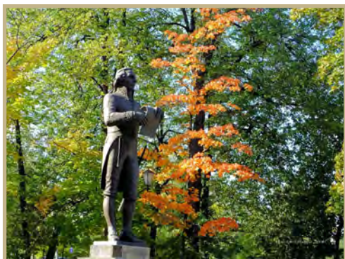
Памятник Олонецкому губернатору Г.Р. Державину в Губернаторском парке Петрозаводска

Позднее образы Карелии вошли в его творчество: стихотворения « Буря », « Лебедь », « Ко второму соседу », « На Счастье », « Водопад ».