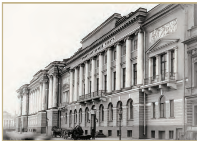
Фасад здания Сената со стороны Английской набережной

Державинское исследование « Мнение о правах, преимуществах и существенной должности Сената » (1801) иногда называют «Конституцией