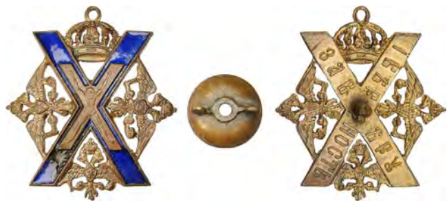
Знак лейб-гвардии Преображенского полка (для нижних чинов)

обходительным; также представлять на театре трагедии Сумарокова, танцевать и фехтовать, что сделало питомцев хотя в науках не искусными, однако же доставило „людность“ и некоторую развязность в обращении». «Нас научали тогда вере — без катехизиса; языкам — без грамматики; числам и измерению — без доказательств; музыке — без нот, и тому подобное. Книг, кроме духовных, почти никаких не читал». Позже самообразованием Державин во многом нивелировал все пробелы в знаниях.