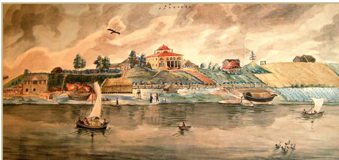
Званка. Е.М. Абрамов, 1807

Не было Державину равных в изобретательности новой, разнообразной строфики, необычной рифмовки, смелого смешения рифмующихся и белых стихов. Он был абсолютный экспериментатор, первый русский модернист, открытия которого понастоящему не освоены до сих пор.