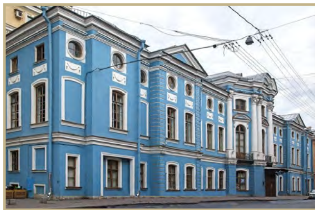
2. Современный вид здания

Санкт-Петербург, Итальянская ул., 25, Малая Садовая ул., 1 Дворец Шувалова, 1755