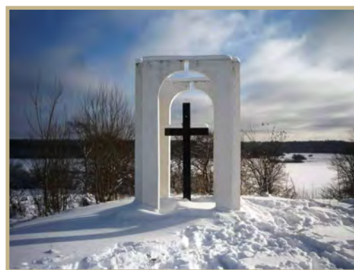
Памятный знак на месте усадьбы Г. Р. Державина «Званка»

Имение сильно пострадало в годы Великой Отечественной войны, после чего все постройки были разобраны. В 1993 году в Званке на вершине Званского холма на берегу реки Волхов был установлен памятный знак, у которого проходят Державинские чтения. Ландшафт усадьбы «Званка» — объект культурного наследия.