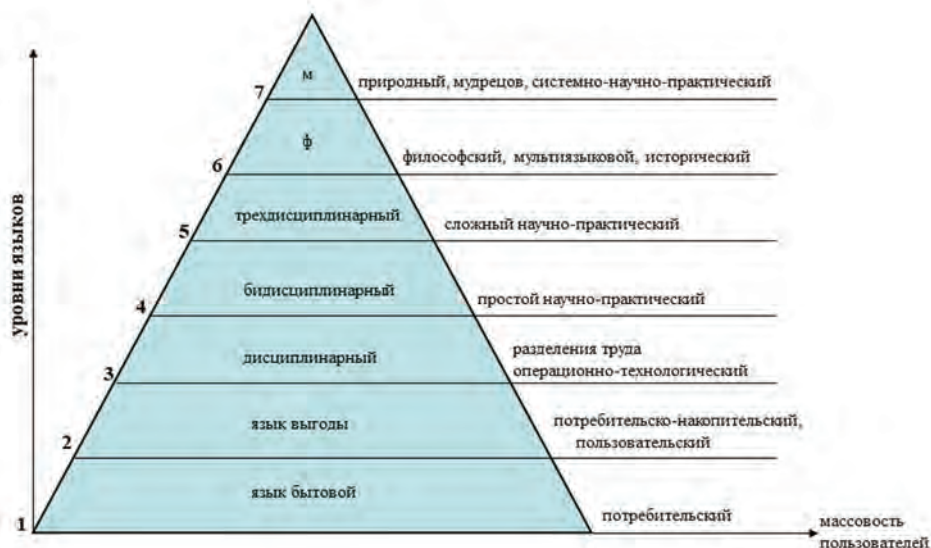
Рис.1. Пирамида интеллектуальной иерархии языков

основе. Далее постепенно происходит переход к терминологии, применимой во всех областях знаний касательно своих интересов.