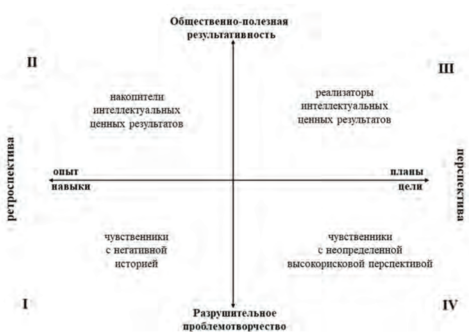
Рис.2. Модель интеллектуальной деятельности личности (ИДеМ)

странство субъекта интеллектуальной природы, разделенное на две оси координат: временную и деятельностную. Временная ось рассекает жизненный цикл личности на прошлое и будущее, при этом точка пересечения координат есть настоящее. По вертикали модель интеллектуального пространства также разделена на две части: успехи и неудачи. По опыту анализа самых продуктивных и полезных интеллектуалов представляется, что без неудач не бывает успехов. Именно неудачи являются важным и регулярным стимулом для дальнейшего интеллектуального самосовершенствования.