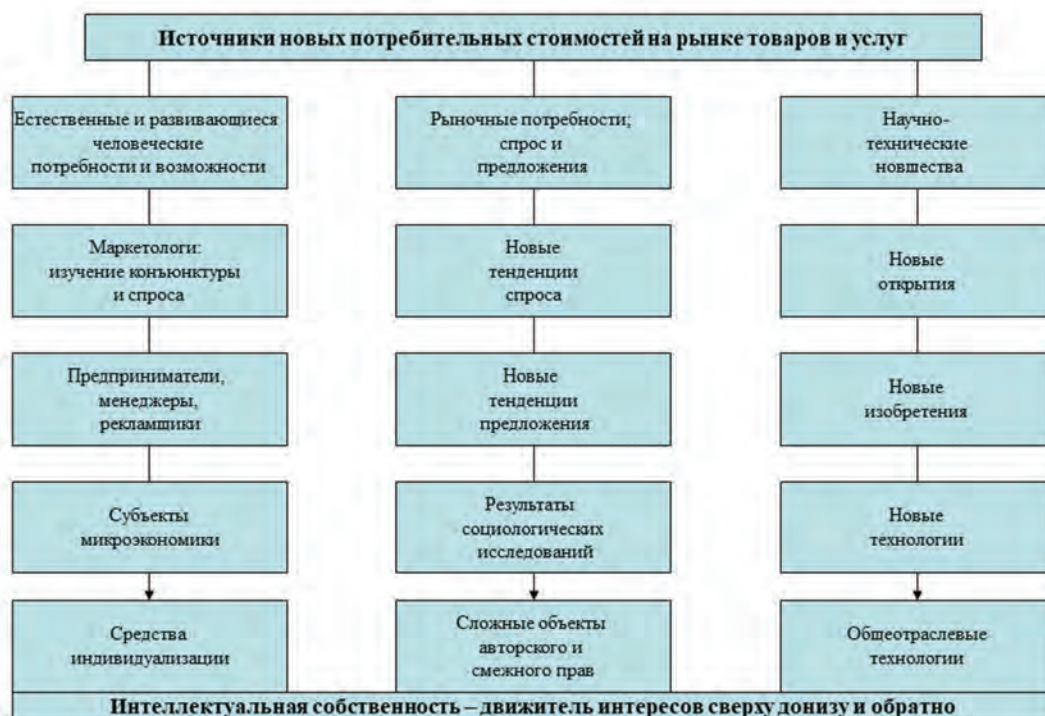
Рис.4. Структура источников новых потребительских стоимостей

интеллектуальной собственностью, поскольку она за последние столетия нормативно четко идентифицирована во всех ее аспектах. Для всех субъектов экономики первичным объектом управления является именно интеллектуальная собственность, где правообладателями прав на результаты интеллектуальной деятельности преимущественно являются юридические лица, начиная от государства, министерства и самих научных, образовательных и лечебных организаций, управляющих всем процессом воспроизводства и реализации этих прав на практике. А авторами в соответствии с нормами международных конвенций и нормами российского законодательства являются физические лица как специалисты, интеллектуалы и творцы медико-биологического прогресса.