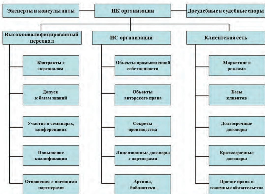
Рис.3. Структура функциональных блоков системы управления правами интеллектуальной собственности организации

тому же эти меры в рамках системы позволят обеспечить дополнительные немалые доходы реальным авторам и правообладателям эффективных методов, методик и лекарственных препаратов. Содержание такой системы управления правами интеллектуальной собственности, по нашему мнению, должно включать ряд функциональных блоков, отображенных на схеме (см. рис. 3).